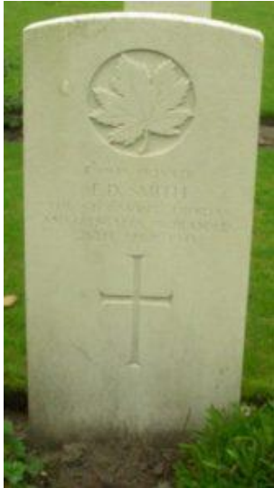
Grafsteen, zonder extra tekst.