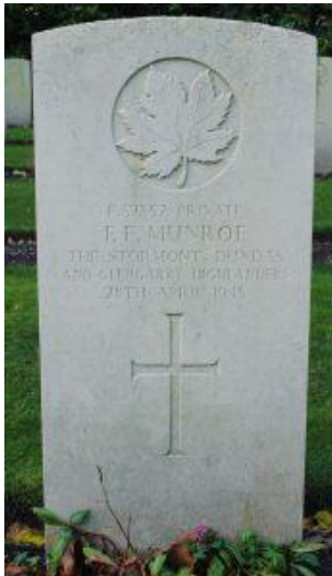
Munroes graf in Holten.

Een week nadat hij in de golven van de Eems was verdwenen, werd zijn stoffelijk overschot aangetroffen langs de oevers van de rivier. Gravelle werd in Holten begraven: plot 11, rij D, graf 5.