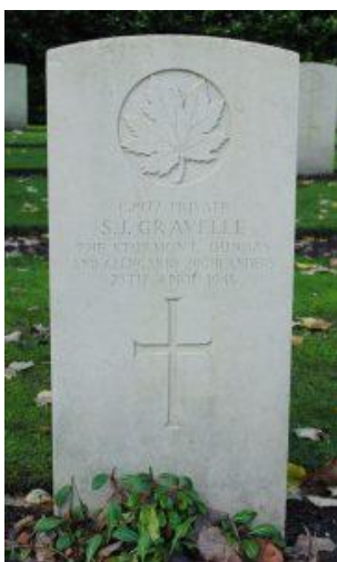
Gravelles graf.