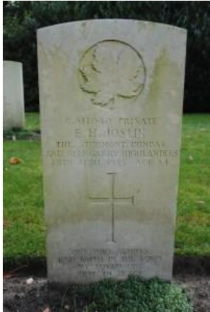
Joslins graf in Nijmegen.

Op één na: boerenzoon Earl Harcourt Joslin , (geboren op 20 april 1911). Joslin was lange tijd vermist nadat hij in het koude Eemswater verdween.