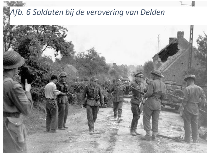
Afb. 6 Soldaten bij de verovering van Delden