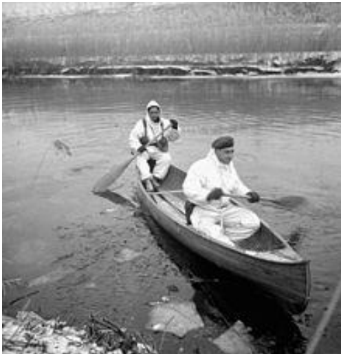
Afb. 5 Soldaten in kano's bij Kapelsche veer 12