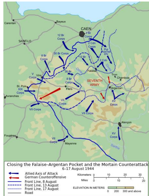
Afb. 3 Schematische weergave Falaise Gap

Vervolgens waren The Lincs in augustus ook betrokken bij de gevechten van de Falaise Gap in Nederland ook wel bekend als de 'Zak van Falaise'. Deze strijd hield in dat de geallieerden om de Duitse troepen heen gingen, maar er bleef een opening waardoor de Duitsers konden ontkomen. Dit was een strook van ongeveer 25 kilometer breed, de Poolse 1 e pantserdivisie sloot de opening om de Duitse soldaten te hinderen. Toch lukte het een aantal Duitse eenheden te ontvluichten, wel maakten de Polen zo'n 5000 Duitsers krijgsgevangen. Tussen 18 augustus en 21 augustus is de 25 kilometer brede strook geslonken tot 8 kilometer breed. Dagelijks werd die strook met 80.000 granaten beschoten en er waren regelmatig luchtaanvallen. Op 1 september was deze strijd afgelopen 6 .