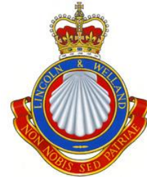
Afb.1 Cap badge The Lincs

Het Canadese leger bestaat uit verschillende delen, zo heb je de 1st Canadian corps en de 2nd Canadian corps. Zo zijn er nog veel meer verschillende onderverdelingen in het Canadese leger, ieder afzonderlijk deel van het leger was weer onderverdeelt in divisies. Die divisies waren weer onderverdeelt in verschillende gevechtsonderdelen, zoals: artillerie, infanterie enz. het Lincoln en Welland regiment hoorde bij de infanterie 3 .