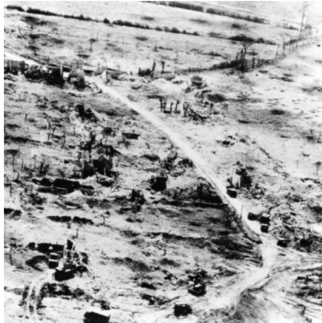
Afb. 2 Dit was er na de slag nog over van Tilly La Campagne

In december 1943 is het Lincoln and Welland regiment (the lincs) met de SS Louis Pasteur van Canada naar Engeland vertrokken voor training. In Augustus 1944 waren The Lincs voor de eerste keer betrokken bij gevechten. Dit was bij Tilly la Campagne. Hier volgt een korte samenvatting van dat gevecht. De strijd om Tilly La Campagne begon op 25 juli. Voorafgaand aan het vechten op de grond was er een groot luchtbombardement, door de slechte verbindingen was de communicatie tussen de verschillende eenheden niet helemaal goed, hierdoor ging het één en ander mis.